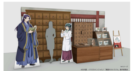
展示ブースイメージ

各大学のオープンキャンパスでは、作中にも登場する、冬虫夏草、牛黄（ごおう）といった素材や、調薬に用いる貴重な道具を実際に展示する特設コーナーを設置します。作品のイラストを使用した解説パネルとともに、薬学の世界を体感いただけます。また展示ブースにはオリジナル描き下ろし等身大パネルと写真撮影が可能なフォトスポットも展開します。