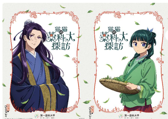
クリアファイルイメージ